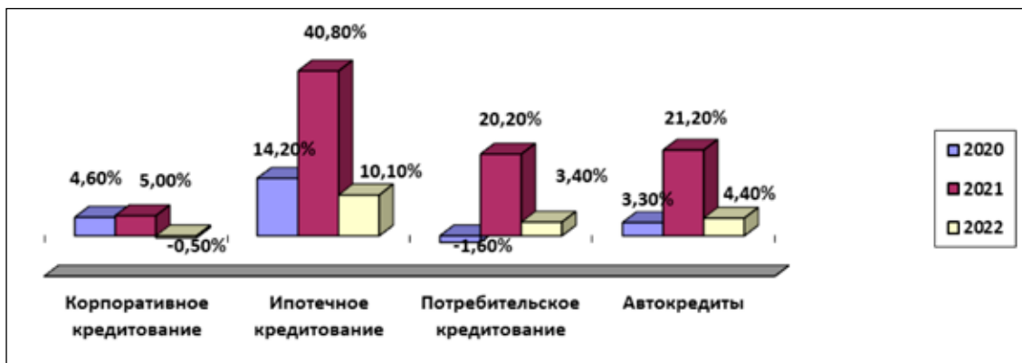
Рис. 2. Динамика темпов и объемов в структуре банковского кредитования за период с 2020 по 2022 гг., % [6]

Традиционно преобладающее значение в формировании потенциала финансового сектора российской экономики приходится на банки и банковские услуги. Банковский сектор показывает устойчивый рост и является крупнейшим сегментом российского финансового рынка. В условиях современных трансформаций финансового сектора, неопределенности политической и экономической ситуации в стране банки остаются основным источником финансирования бизнеса и населения.