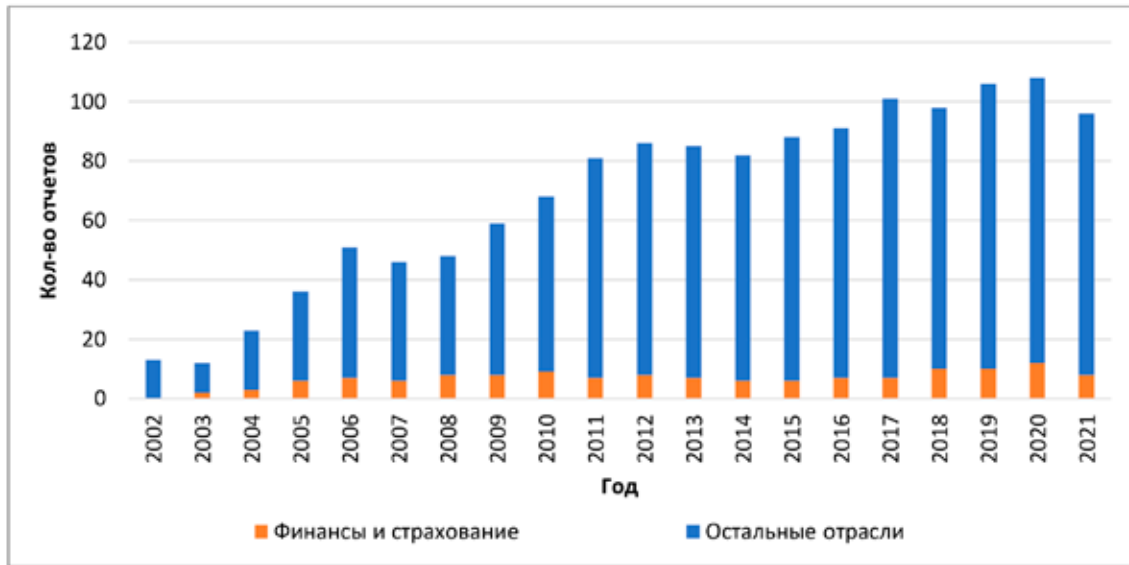
Рис. 3. Динамика публикации нефинансовых отчетов российскими компаниями, зарегистрированными в национальном регистре РСПП Составлено автором по [18]

«Во многих компаниях внедрение E-факторов в деятельность, начатое в 2020 и 2021 годах, будет просто невыгодно сворачивать, учитывая стадию реализации и возможность окупить вложенные инвестиции». Развитие S-принципов также сложно остановить: с 1 марта вступили в силу изменения в российском законодательстве, усиливающие обязательные требования к трудоустройству граждан с инвалидностью. Пока законодательные требования не будут отменены, компаниям нужно будет создавать условия для инклюзивного трудоустройства [4].