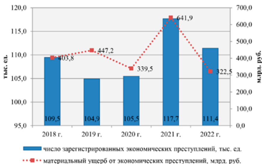
Рис. 2. Динамика зарегистрированных в России экономических преступлений и материального ущерба от их совершения