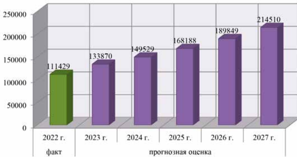
Рис. 3. Прогнозная оценка динамики уровня экономической преступности в России на период до 2027 г.

Тесную связь между выделенными в рамках исследования факторами и числом экономических преступлений, ежегодно регистрируемых органами контроля, подтверждает значение коэффициента множественной корреляции, который составил 0,952 пунктов. При этом коэффициент детерминации позволяет говорить о том, что 90,6% изменений в динамическом ряде числа экономических преступлений в России объясняются обозначенными показателями-факторами.