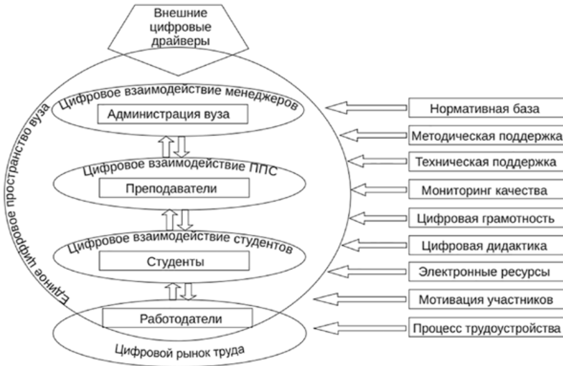
Рис. 1. Цифровое взаимодействие в ВУЗе [2]

Несмотря на то, что реформирование образования происходит непрерывно, в свете событий 2022 г., СВО, санкционное давление других стран и разрыв партнерских отношений с зарубежными ВУЗАМИ стали катализатором и даже ключевым драйвером коренных преобразований в образовательной системе. К ряду планируемых изменений, согласно [3, 4], относятся: