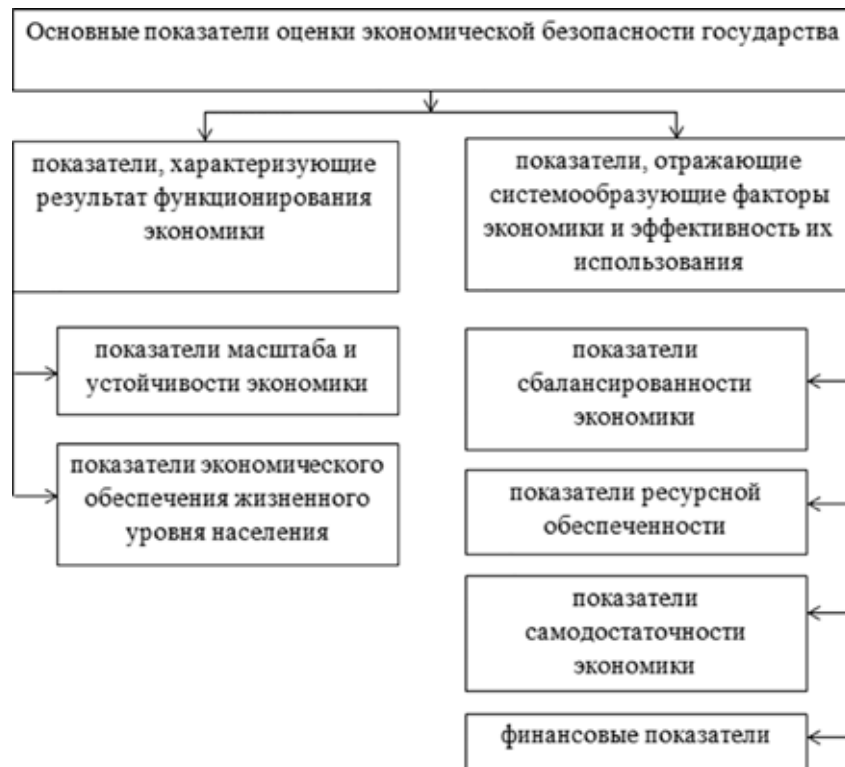
Рис. 3. Структура показателей оценки экономической безопасности РФ

Вторая группа включает уровни обеспеченности населения основными товарами, безработицы, расслоения населения по уровню доходов, индекс среднедушевых доходов. Эти показатели отражают уровень благосостояния населения и его материальную основу – доходы населения.