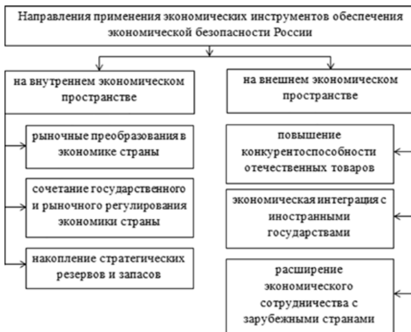
Рис. 2. Направления применения экономических инструментов обеспечения экономической безопасности России.

На внутреннем экономическом пространстве страны государством проводятся целенаправленные преобразования эконо-