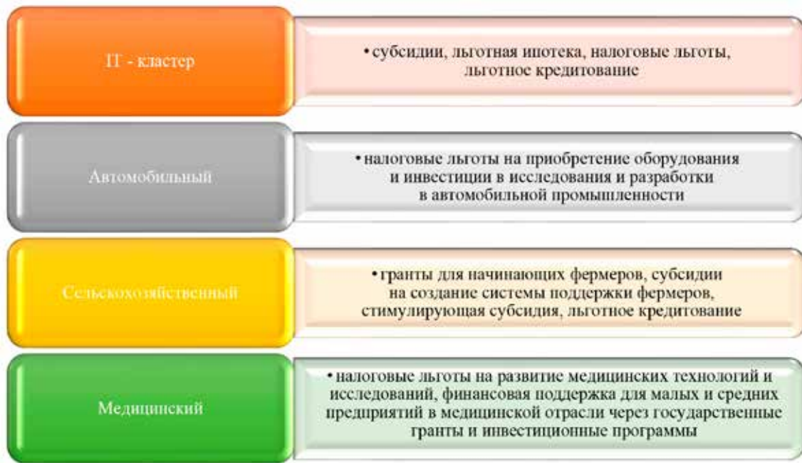
Рис. 4. Инструменты государственной финансовой поддержки малого и среднего предпринимательства при кластерном подходе

Кроме того, применения кластерного подхода позволяет выявлять проблемы и вызовы, с которыми сталкиваются предприятия, и разрабатывать инновационные решения для их решения. В связи с этим, определим проблемы, с которыми сталкиваются малые предприятия в каждом отраслевом кластере и приведет соответствующие им пути решения (таблица 3).