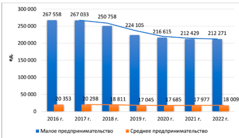
Рис. 3. Динамика количества субъектов малого и среднего предпринимательства за 2016–2022 гг., ед.

Согласно данным, представленным в реестре субъектов малого и среднего предпринимательства, была построена диаграмма по количеству субъектов малого бизнеса за 2016–2022 гг., которая представлена на рисунке 3. Из анализа можно заметить, что количество субъектов малых предприятий (без учета индивидуальных предприятий и микропредприятий) с каждым годом уменьшается. За анализируемый период было ликвидировано около 55 287 ед. малых предприятий. Данное изменение можно связать с тем, что из-за своих ограниченных размеров, недостатка финансирования и сильной зависимости от внешней среды, малые предприятия подвергаются серьезным рискам. У них часто отсутствуют значительные финансовые, организационные и кадровые ресурсы для развития, что приводит к высокому уровню ликвидаций и банкротств.