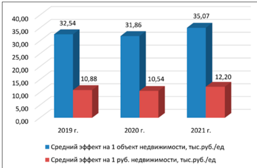
Рис. 2. Динамика показателей эффективности формирования и использования имущества муниципального образования «Город Курск» в 2019-2021 гг., млрд руб.

Данная методика в целом доказывает предыдущие результаты, согласно которым эффективность использования имущества муниципального образования «Город Курск» находится на достаточном уровне, демонстрирует устойчивую тенденцию к росту. В частности, можно отметить что наблюдается устойчивый рост конечного эффекта от использования муниципального имущества по направлению формирования на единицу муниципального имущества и на 1 руб. муниципального имущества находящегося на балансе города Курска.