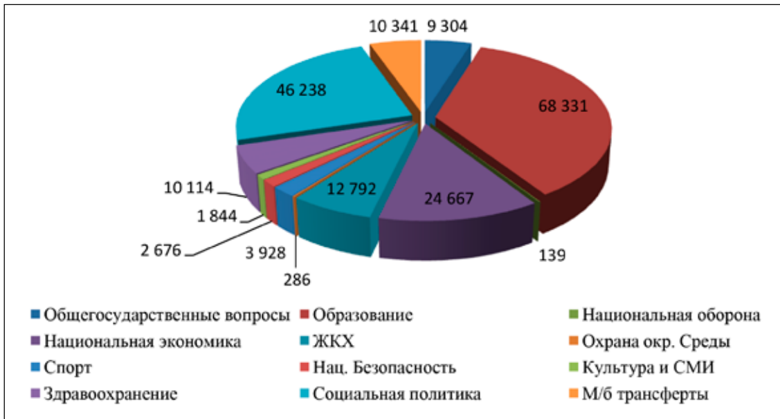
Рис. 1. Структура расходов республиканского бюджета Республики Дагестан на 2023 год по разделам и подразделам классификации расходов

По данным табл. 1, можем отметить, что на 2023 год прогнозируется прирост среднегодовых темпов по всем показателям в отношении 2022 года, причем, наибольший прирост ожидается по уровню отгруженной продукции и инвестиций в основной капитал, соответственно на уровне 107%. Развитие инвестиционного климата региона определяется, прежде всего, структурой программных расходов бюджета [4].