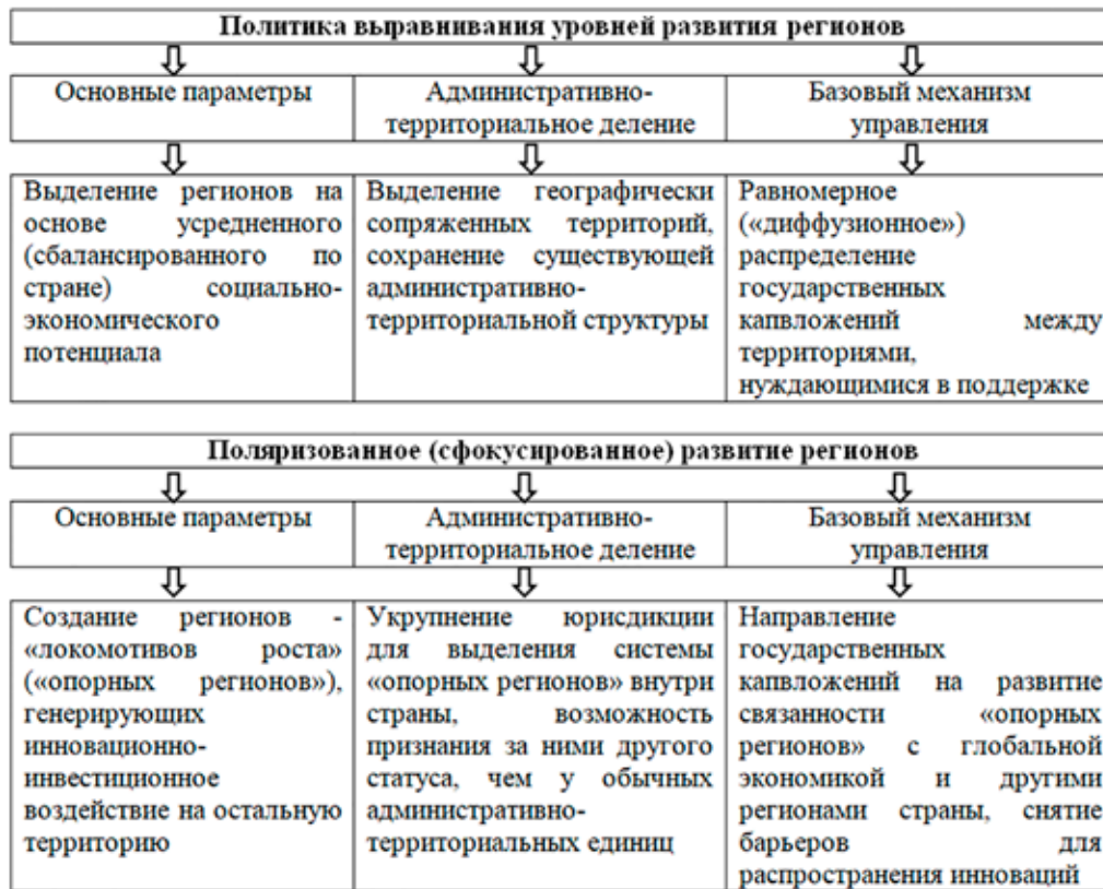
Рис. 2. Модели региональной политики [2]

Важно отметить, что региональная экономическая политика России действует на федеральном и на субфедеральном уровне.