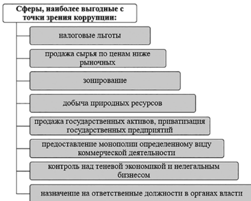
Рис. 2. Сферы, наиболее благоприятные с точки зрения коррупции

ния как способа разрешения гражданско-правовых и корпоративных конфликтов и устранения конкурентов. В сети Интернет появились специализированные платформы, предлагающие «устранить конкурента» на коммерческой основе. Об этом свидетельствуют и коррупционные скандалы, периодически поражающие правоохранительную систему, когда выявляются факты получения многомиллиардных взяток в отношении представителей высшего уровня следственных и надзорных органов в сфере уголовной юстиции. Стоимость обнаруженного имущества в форме ценностей, средств на счетах, недвижимости указывает на то, что основным источником таких выплат, в большинстве случаев, являются субъекты предпринимательской деятельности.