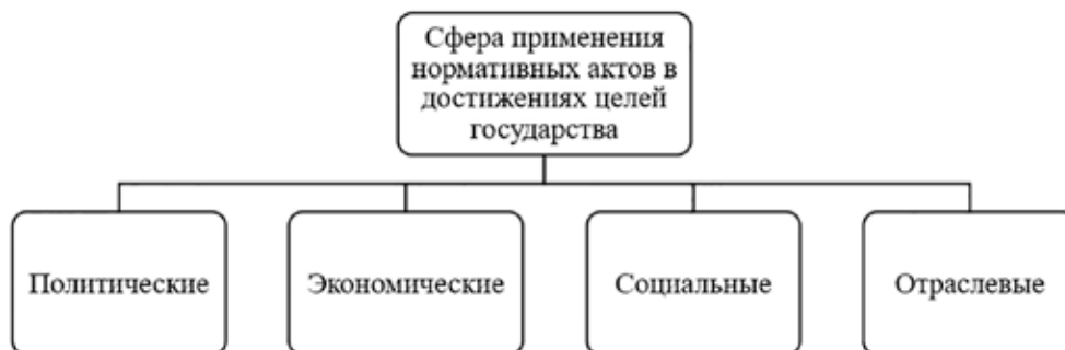
Рис. 3. Сфера применения нормативных актов в достижениях целей государства [4]