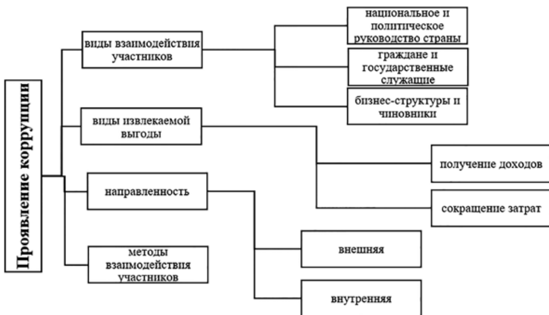
Рис. 1. Проявление коррупции [3]

2. Этические оценки разных видов коррупции: некоторые действия рассматриваются как аморальные, другие как преступные.