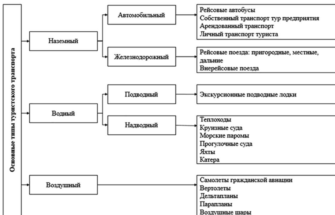
Рис. 1. Основные транспортные средства, используемые в туристической деятельности

Транспортная сеть России включает в себя около 88 тысяч километров железнодорожного полотна, более 755 тысяч километров дорог с твердым покрытием, более 600 тысяч километров воздушных линий, 70 тысяч километров магистральных нефтепроводов, более 140 тысяч километров Газопроводы, 115 тысяч километров речных судоходных путей.