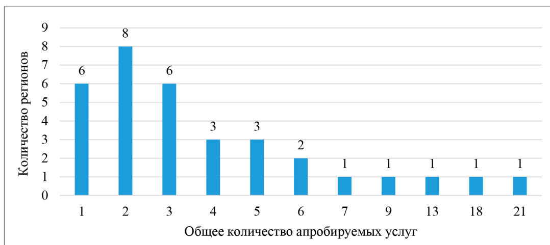
Рис. 2. Распределение регионов в зависимости от общего количества апробируемых в 2024 году услуг