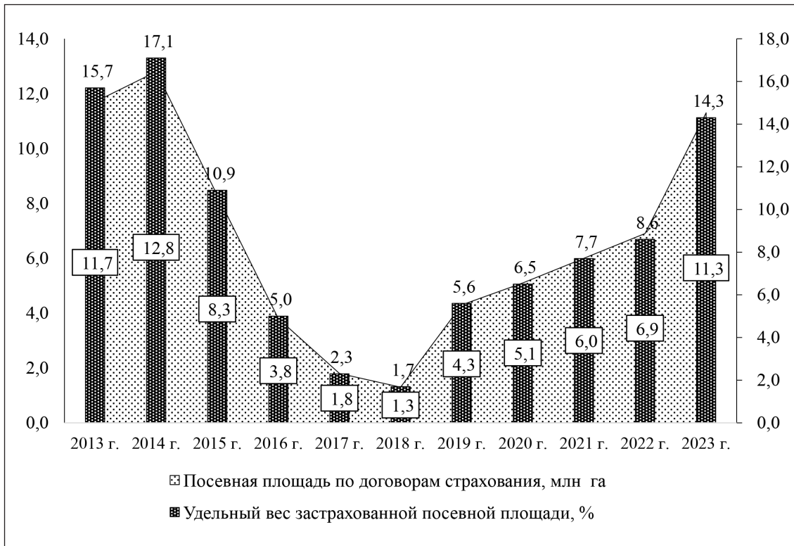
Рис. 3. Посевная площадь, застрахованная по договорам страхования урожая сельскохозяйственных культур, осуществляемого с государственной поддержкой [4]

Для того, чтобы финансово стимулировать регионы, была осуществлена привязка размера возмещения полученного ущерба в результате наступления чрезвычайной ситуации из федерального бюджета к уровню поддержки программы субсидируемого агрострахования. В частности, при недостаточной активности региональных органов власти в вопросах обеспечения страховой защитой производителей сельскохозяйственной продукции, устанавливались лимиты в компенсации не более 50% размера фактически подтвержденного ущерба.