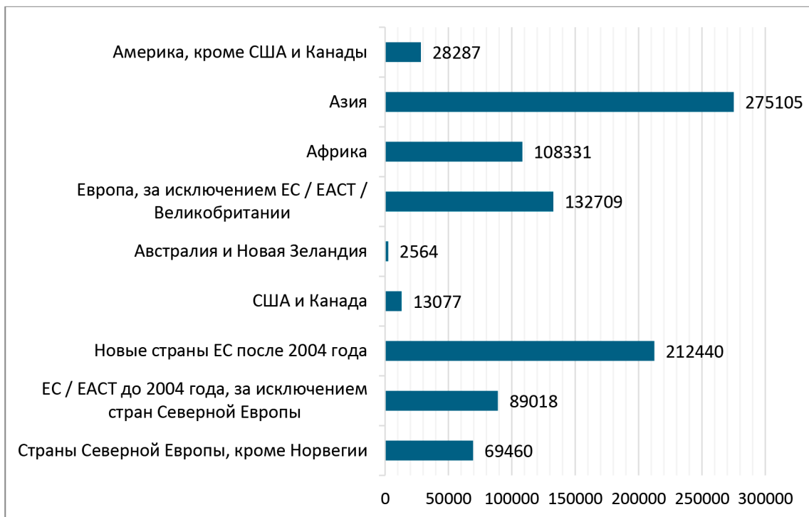
Рис. 1. Численность иммигрантов в разрезе стран и регионов мира (на 1 января 2024)