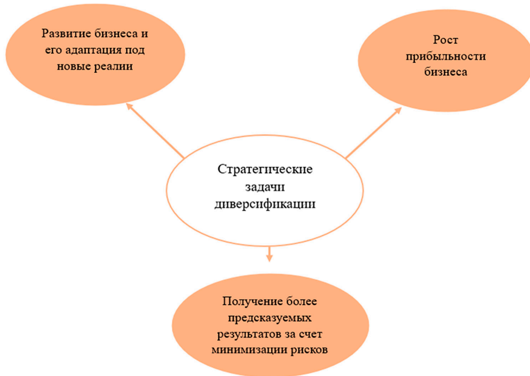
Рис. 2. Стратегические задачи диверсификации