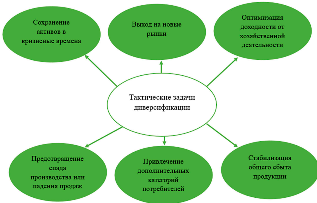
Рис. 1. Тактические задачи диверсификации

В рамках текущего исследования были использованы труды отечественных и зарубежных авторов по данному вопросу, также в исследовательской работе применялись следующие методы: абстрактно-логический, метод экономического моделирования, дедукция, сравнение и сопоставление и другие.