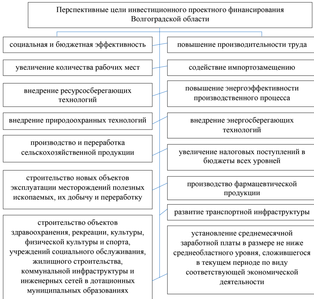
Рис. 3. Перспективные цели инвестиционного проектного финансирования Волгоградской области

В планах по развитию Волгоградской области включена программа по совершенствованию здравоохранения. На данную программу запланировано выделить 11 млрд рублей до 2025 года. Наконец, наиболее значимыми следует признать проекты, представленные на рисунке 3.