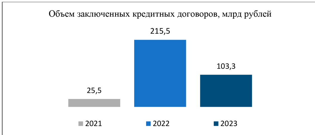
Рис. 1. Объем заключенных кредитных договоров, млрд рублей