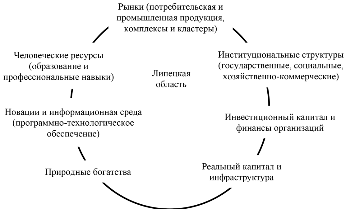
Рис. 1. Элементы конкурентной среды региона

Перечисленные семь направлений конкуренции используются, как при оценке состояния регионального бизнеса (уровня конкурентоспособности предприятий, комплексов, кластеров), так и региона в целом. Использование данного метода, делает привлекательным его при исследовании взаимосвязи конкурентных преимуществ региона и предприятий, и в перспективе будет способствовать повышению социально-экономической эффективности региона по всем направлениям конкурентной борьбы. Необходимо отметить, что конкурентоспособность региона и формирование конкурентных преимуществ региона на прямую зависят от условий социально-экономического развития, созданных на его территории.