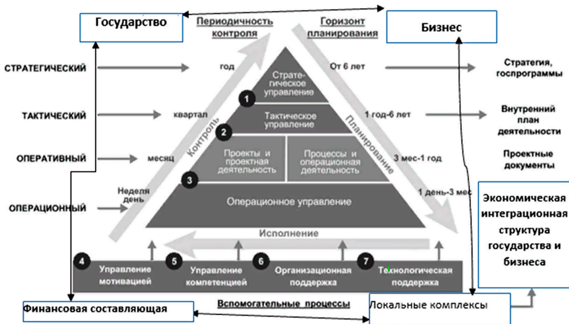
Рис. 4. Создание экономической интеграционной структуры на основе проектной деятельности государства и бизнеса

15. простота в формировании интеграционной структуры означает легкость в приспособлении, понимании данного института.