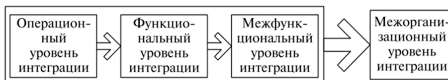
Рис. 2. Взаимосвязь уровней интеграции деятельности организации [1, с. 21]

Можно сказать, что каждое структурное подразделение существует изолированно от всего предприятия (организации) имеет свои цели, задачи, показатели. Здесь на первый план выходят разработка пооперационных карт, графиков Ганта, описание бизнес-процессов. Далее в процессе интеграции образуются финансовая, маркетинговая, интеллектуальная, инвестиционная и производственная составляющие, которые образуют экономическую интеграцию.