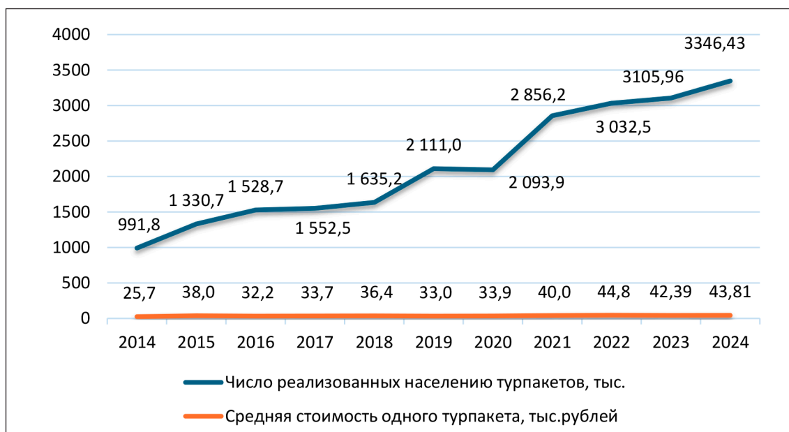
Рис. 3. Прогноз числа и стоимости реализованных населению турпакетов в 2014-2024 гг. Источник: рассчитано автором на основе [9]

Произведя расчет, получим, что сумма дополнительно необходимых бюджетных средств в 2024 году составит: