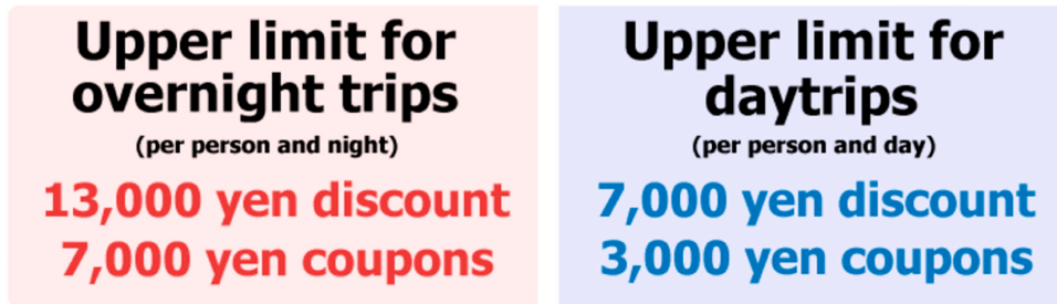
Рис. 2. Лимиты скидок и купонов по программам «Go To Travel» и «Общениациональная скидка на путешествия» в Японии

Скидка применяется только в том случае, если они являются частью плана путешествия. Например, скидка не может быть применена к обычным покупкам авиабилетов или арендованных автомобилей; однако она применяется, если перелет или аренда автомобиля являются частью туристического пакета, продаваемого через зарегистрированное туристическое агентство. Аналогичным образом, если мероприятие или питание является частью туристического пакета, акция применяется. Кроме того, полученные купоны можно использовать для оплаты дополнительных расходов, не входящих в туристический пакет, таких как питание, транспорт и покупка сувениров. Однако купоны можно использовать только в зарегистрированных предприятиях.