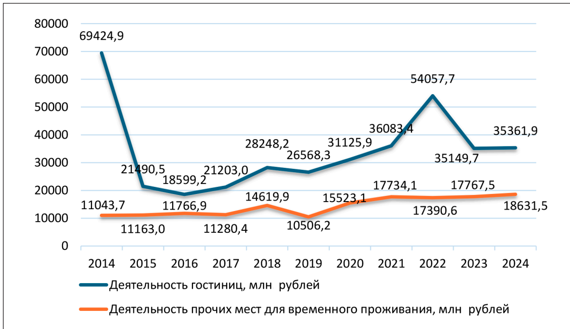
Рис. 5. Прогноз инвестиций в основной капитал в отдельные виды деятельности туризма, 2014-2024 гг. Источник: Рассчитано автором на основе [9]