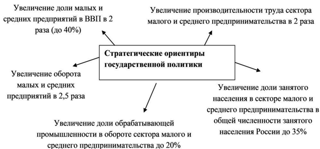
Рис. 1. Стратегические ориентиры политики государства в сферах малого и среднего бизнеса до 2030 года

По данным, предоставляемым [1], в РФ на конец 2021 г. число работников, занятых в сфере малого бизнеса, превысило показатель в 10,6 млн человек [2, 3]. Данный факт подтверждает утверждение, что именно сфера малого предпринимательства вносит существенный вклад в уровень занятости трудового населения РФ, а также вносит посильный вклад в рост уровня жизни населения страны.