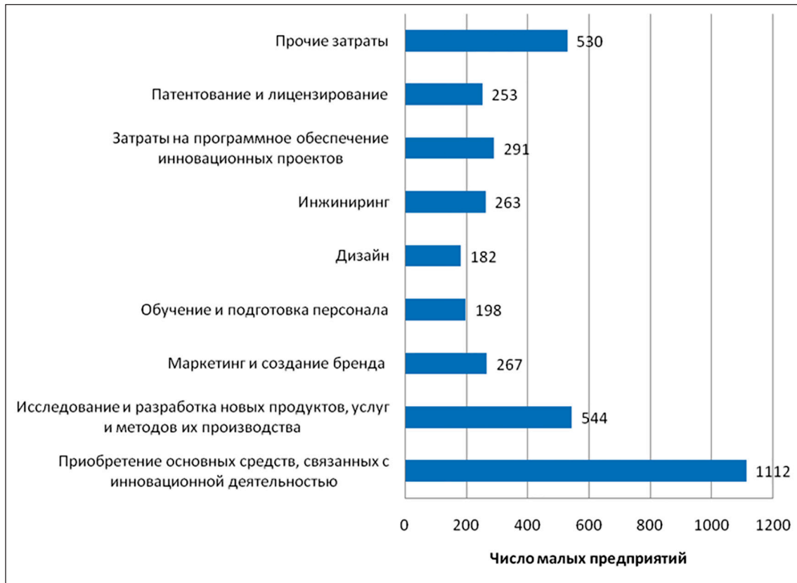
Рис. 2. Затраты на инновационную деятельность по видам затрат (на основе данных Росстата за 2021 год)

Сфера малого предпринимательства является важным звеном в цепочке создания ценности конечного продукта, поставляя сырье, материалы, комплектующие для среднего и крупного бизнеса, порождает здоровую конкуренцию, приводящую к повышению качества товаров и услуг, производимых и предоставляемых как для отечественного, так и зарубежного рынков [5].