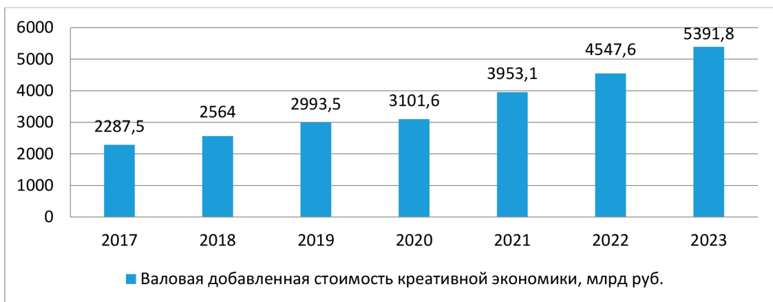
Рис. 1. Валовая добавленная стоимость креативной экономики РФ за период 2017-2023 гг.

Так же активно развивается экспорт креативных услуг, так за 2023 год доля услуг информационно-технологического направления и программного обеспечения составила 94,2% от общего экспорта креативных услуг из России. Помимо данного направления развивается экспорт киноиндустрии, различные виды дизайна, производство рекламы. Все эти направления востребованы более чем в 70 странах. Такой результат показывает необходимость в дальнейшем развитии экспорта креативных услуг, которые будут увеличивать доходы национальной экономики и налаживать международные отношения.