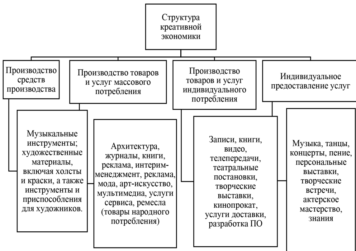
Рис. 2. Структура креативной экономики

1. Компонент «Люди» фокусируется на анализе характеристик креативного сообщества в пределах муниципалитета. В его рамках осуществляется оценка социально-демографических параметров данного сообщества, а также аспектов, касающихся внутреннего взаимодействия его членов.