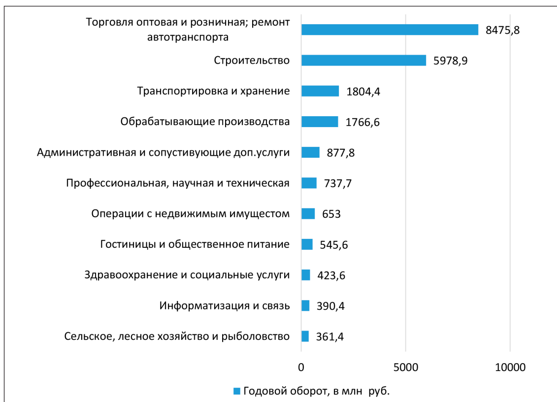
Рис. 2. Основные отрасли, в которых работают малые предприятия Республики Тыва