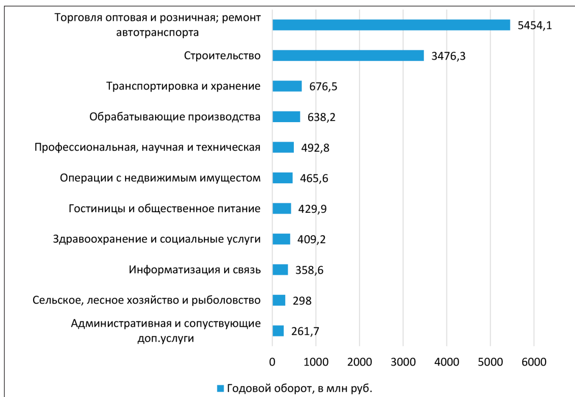
Рис. 3. Основные виды деятельности микропредприятий Республики Тыва за 2023 г., млн руб.