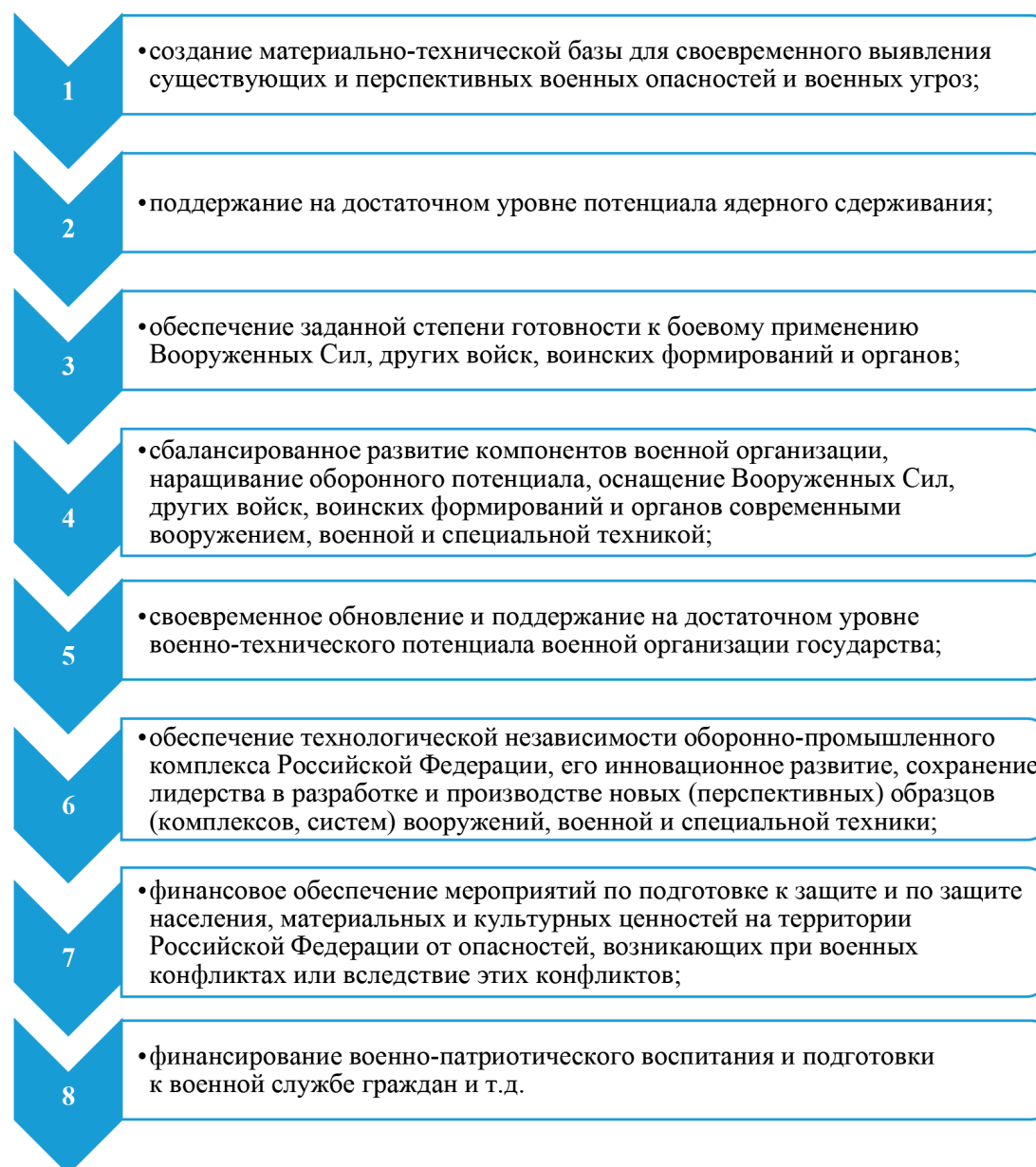
Рис. 2. Задачи военного потребления

Военное потребление проявляется через военные расходы или расходы на национальную оборону. Уровень военного потребления должен быть таким, чтобы гарантировать необходимую степень военной безопасности как в мирное время, так и во время военных конфликтов.