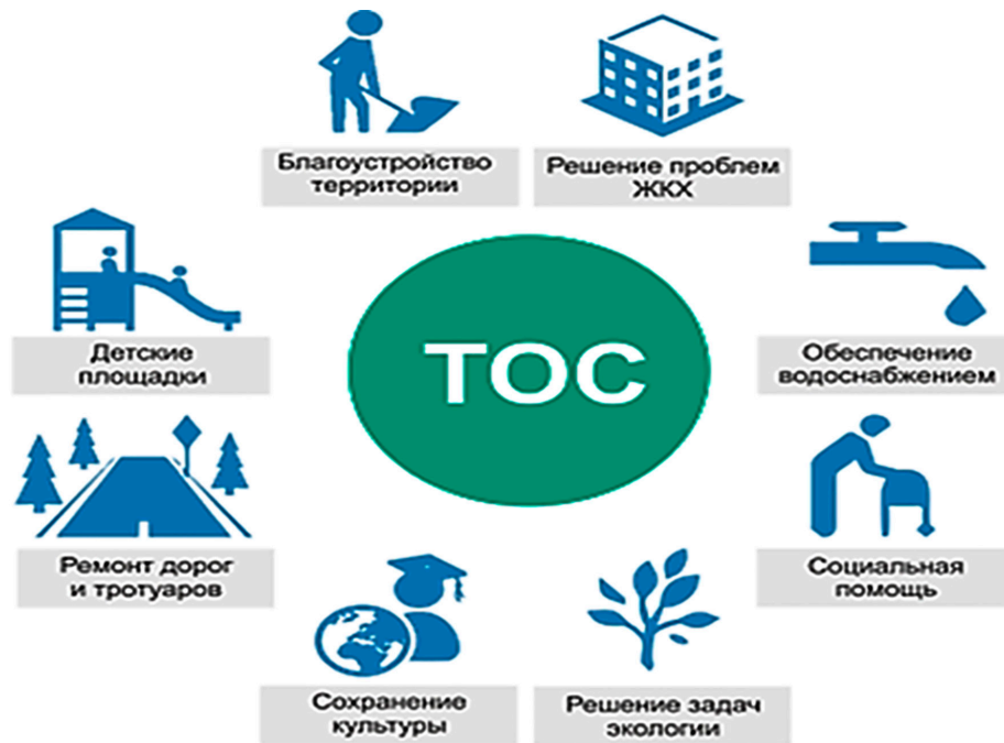
Рис. 1. Основные направления работы органов ТОС

Помимо этого, представительные органы местного самоуправления, в частности депутаты городской думы, играют ключевую роль в механизме инициативного бюджетирования, обеспечивая его правовую основу и организационное сопровождение. Депутаты городской думы в данном направлении являются архитекторами всего процесса, определяя его правила игры и создавая условия для эффективного участия граждан. Также они разрабатывают и утверждают локальные нормативные акты, регламентирующие инициативное бюджетирование на территории муниципального образования. Эти акты, часто оформленные как постановления или решения думы, определяют весь цикл реализации инициатив – от зарождения идеи до ее практического воплощения. В частности, депутаты устанавливают четкие критерии отбора проектов, определяя допустимые виды деятельности, максимальный размер финансирования, а также предметно-тематические рамки. Более того, депутаты могут инициировать проведение информационных кампаний, направленных на популяризацию инициативного бюджетирования и повышение гражданской активности.