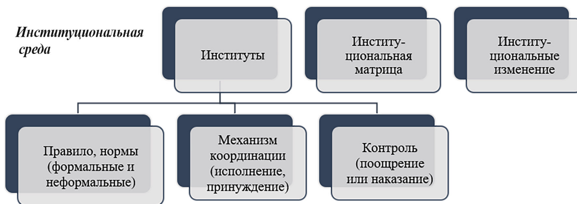
Рис. 1. Логическая схема составляющих институционального подхода

Итак, стратегия – это дорожная карта и компас к нашим будущим целям. Она определяет, чего мы хотим достичь в долгосрочной перспективе, и разрабатывает сценарии, каким образом этого добиться.